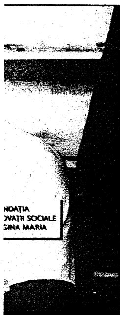
NOȚIA DINĂRII SOCIALE SINA MARIA

d) dovada/înscrisul din care să rezulte că nu i-a fost aplicată una din sancțiunile prevăzute la art. 455 alin. (1) lit. e) sau f), la art. 541 alin. (1) lit. d) ori e), respectiv la art. 628 alin. (1) lit. d) sau e) din Legea nr. 95/2006 privind reforma în dome-